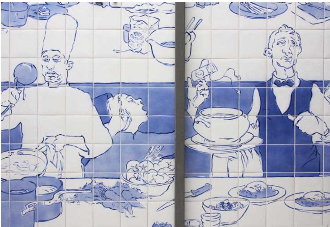
Utsmykking innvendig detalj