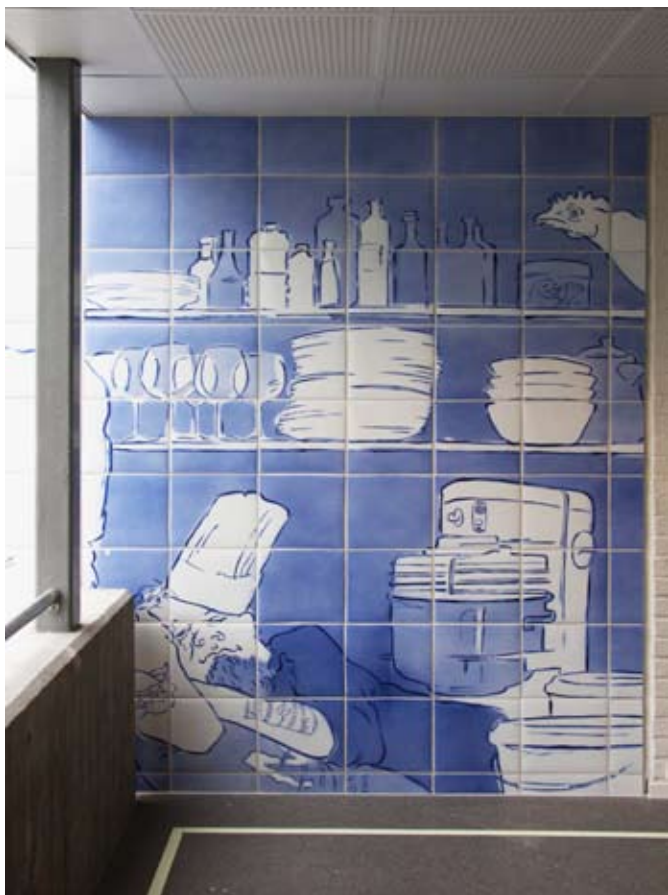
Utsmykking innvendig detalj