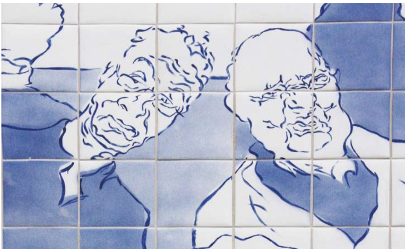
Utsmykking utvendig detalj