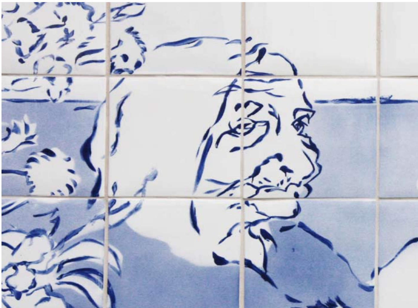
Utsmykking utvendig detalj