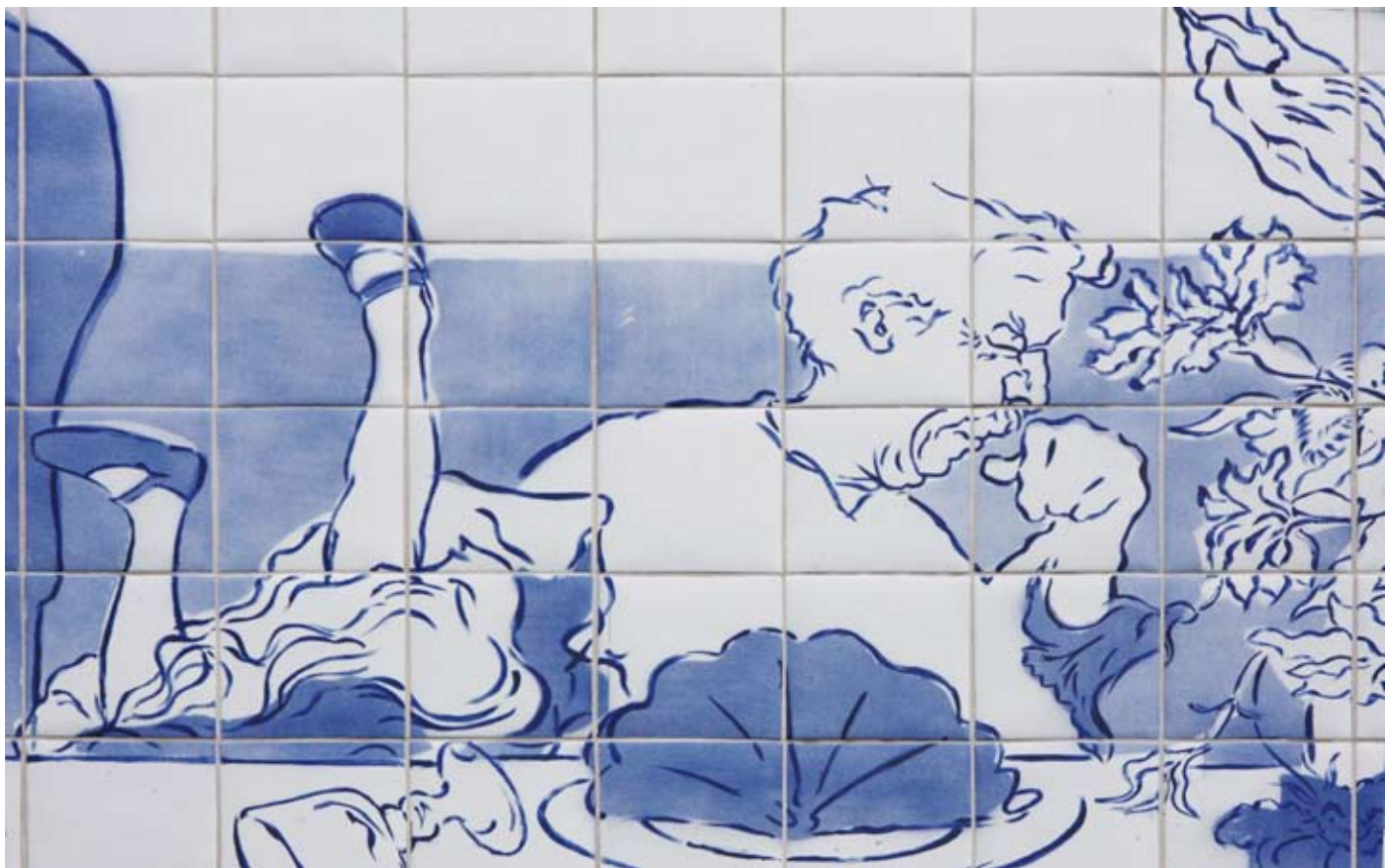
Utsmykking utvendig detalj