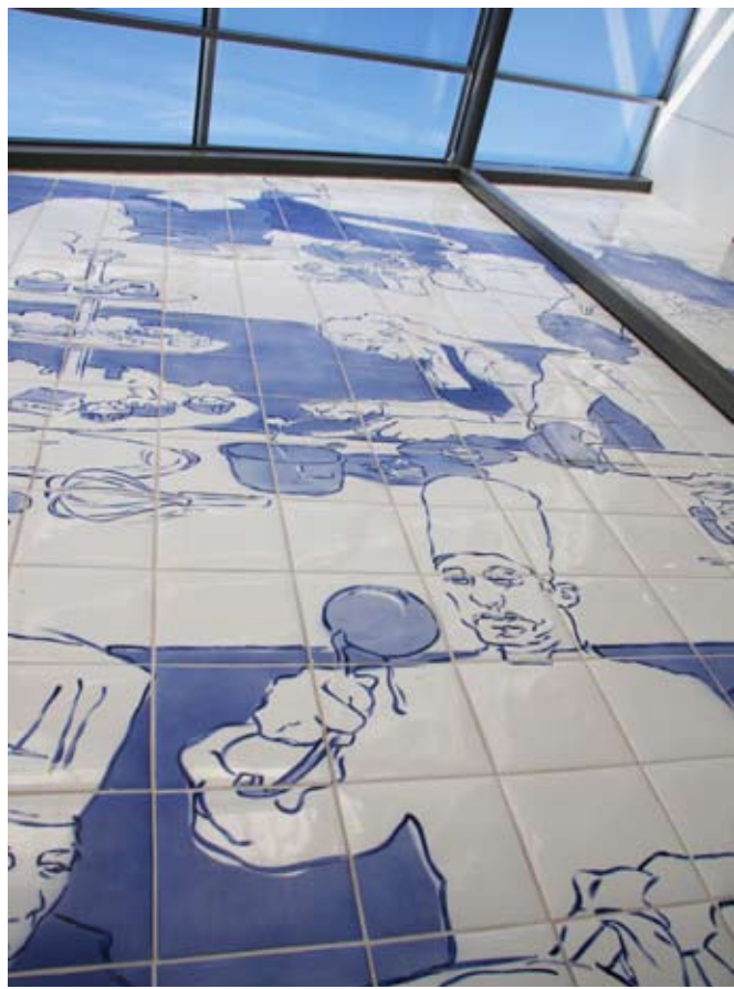
Utsmykking innvendig detalj