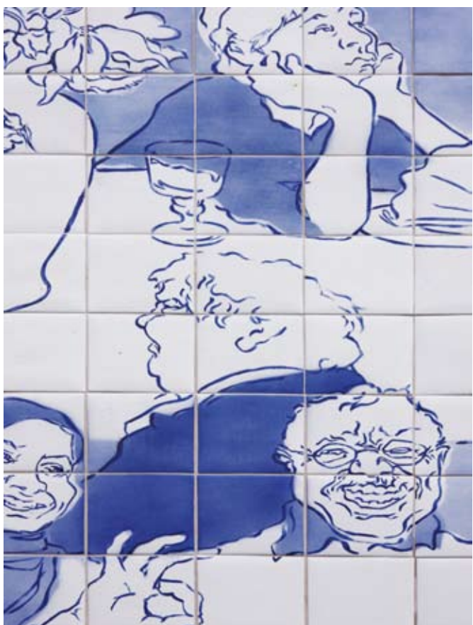
Utsmykking innvendig detalj