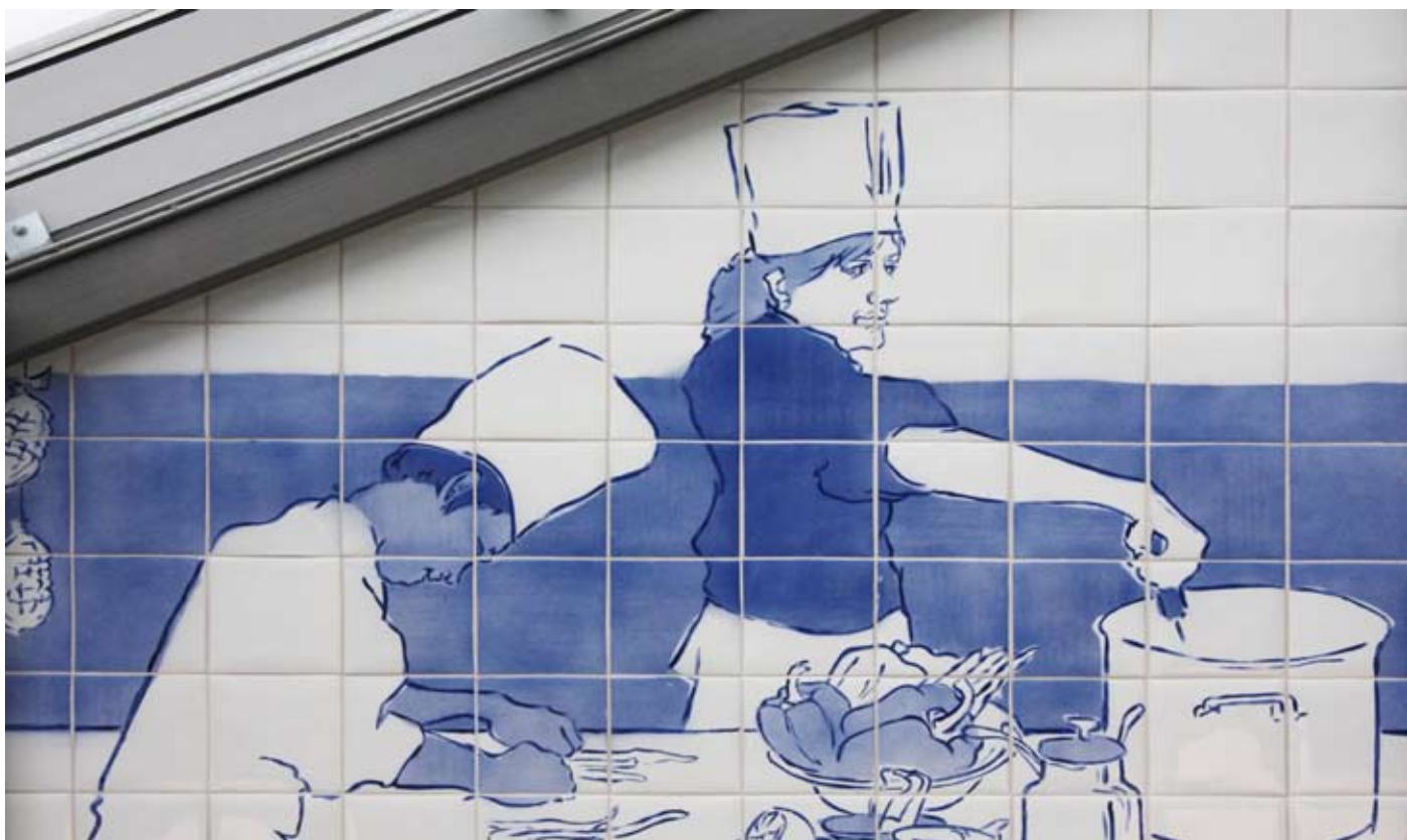
Utsmykking innvendig detalj